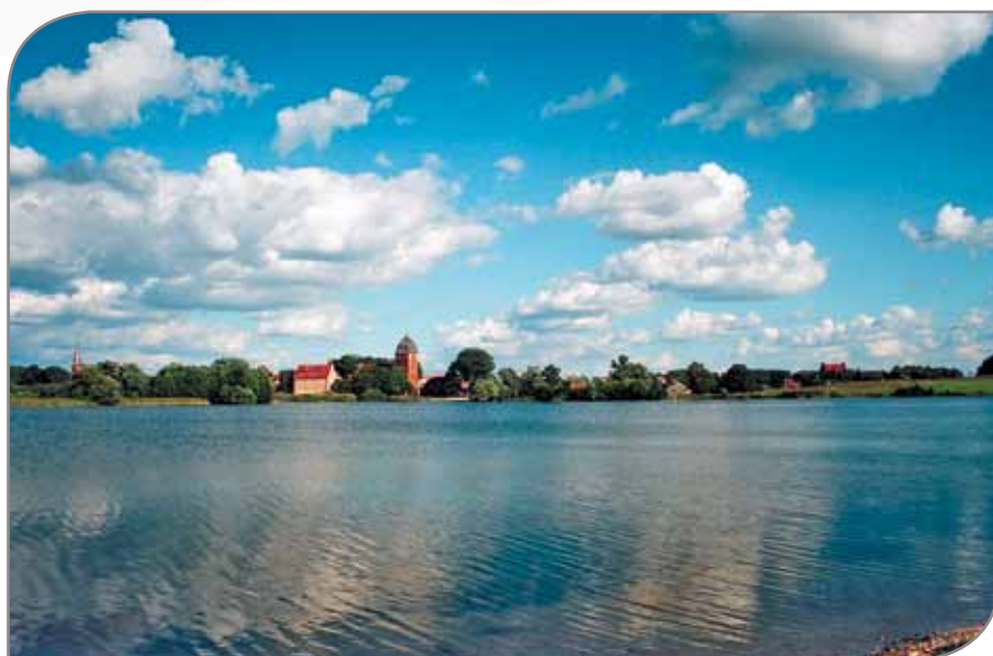
Panorama Pasymia i jeziora Kalwa.

członek Krajowego Komitetu Naukowego polskiej sieci Cittaslow, znawca rynku turystycznego i propagator idei Cittaslow, wieloletni dyrektor Departamentu Turystyki w Urzędzie Marszałkowskim Województwa Warmińsko-Mazurskiego w Olsztynie