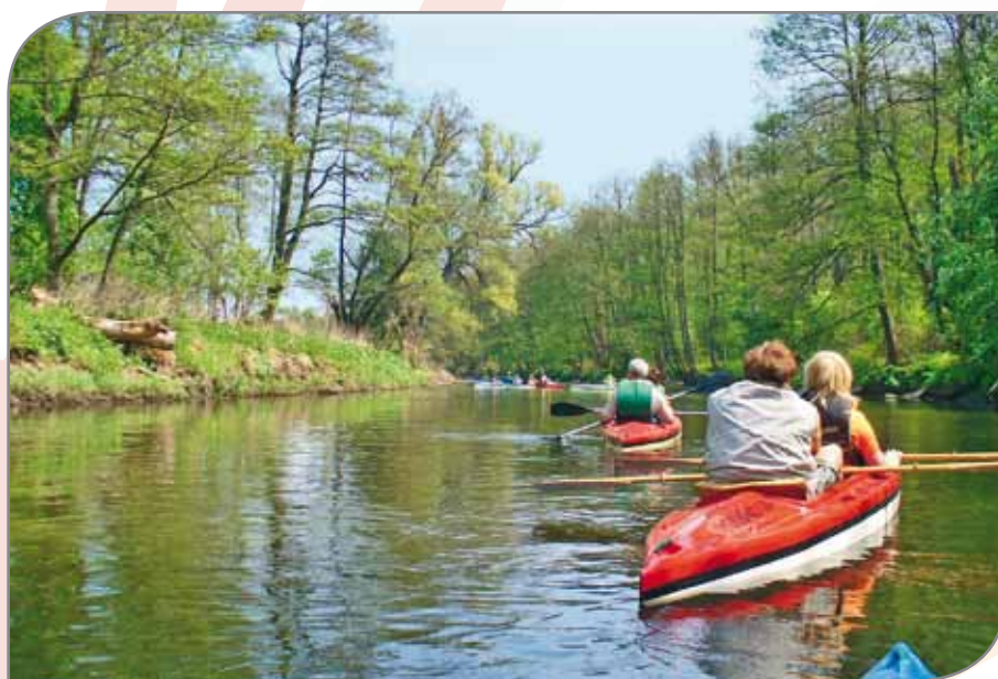
Spływ Łyna-Ława w okolicach Sępopola.

Mam nadzieję, że przynależność do sieci Cittaslow jest i będzie dla mieszkańców, lokalnych aktywistów, przedsiębiorców oraz władarzy miast powodem do dumy w relacjach z innymi podmiotami. I nie tylko z partnerami z zagranicy, lecz przede wszystkim z tymi należącymi do sieci. Stanie się także pretekstem do nawiązania kontaktów z innymi miastami, a rywalizacja o znaczenie, pieniądze, turystów – zostanie zastąpiona współpracą przy realizacji konkretnych projektów. Dzięki temu w przyszłości będziemy świadkami ciągłego rozwijania się aktywnie działającej, silnej sieci silnych polskich miast Cittaslow.