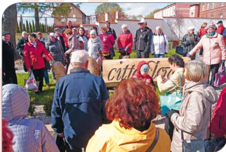
Uczestnicy wycieczki na skwerze Cittaslow w Lidzbarku.

Dla jakości życia w miasteczkach chcących rozwijać się zgodnie z filozofią nieśpieszności istotne jest tworzenia w świadomości mieszkańców poczucia zakorzenienia w „dobrym habitacie”. Częścią owego poczucia jest przekonanie, że władze dbają o członków społeczności lokalnej. W taki zamysł, jak mierniam, wpisują się akcje darmowych szczepień w Lubawie czy działania nakierowane na zapewnienie mieszkań potrzebującym swojego lokum mieszkańcom Rynu. To kierunek poczynań właściwy i pożądany. Choć aby mógł wygenerować istotny potencjał więziotwórczy, musi stać się elementem kompleksu aktywności nakierowanych na aktywizację społeczności lokalnych, chcących wzmacniać więzi społeczne i poczucie związania ze swoim nieśpiesznie funkcjonującym miejscem na ziemi.