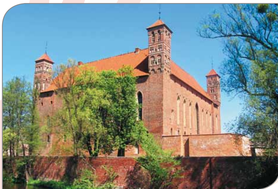
Zamek w Lidzbarku Warmińskim.

Integrację, dodajmy, realizowaną oddolnie (można powiedzieć – partycypacyjnie), z wykorzystaniem twórczości i wzmacnianiem walorów estetycznych. Dzięki temu lokalne wspólnoty kreują niezwykle ciekawe światy kulturowe, mówiąc w ten sposób sobie samym kim są, ale też pokazując innym (nie tylko turystom), że lokalność może być fascynująca i ważna.