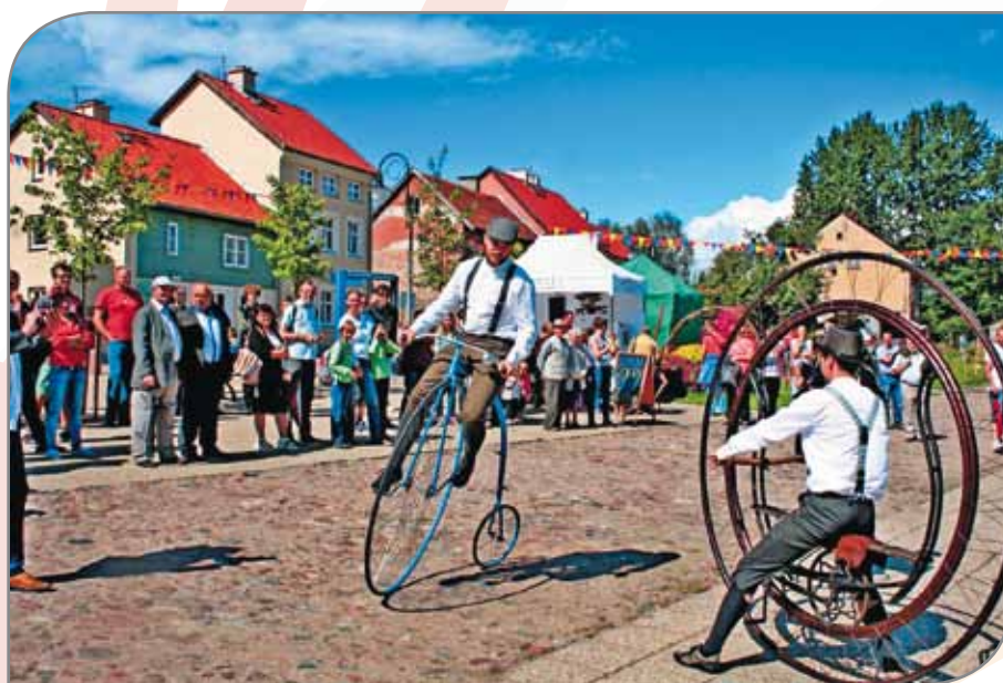
Jarmark Sztuki Rękodzieła w Dobrym Mieście.

W muzyce organowej niełatwo konkurować ze słynną ze swojego instrumentu Świętą Lipką, szczególnie jeśli jest się jej bliskim sąsiadem. Jednak Reszel podjął to wyzwanie, powiększając i tak bogatą ofertę turystyczną. Reszelanie oddaleni od sal koncertowych mają utrudniony dostęp do muzyki klasycznej wykonywanej na żywo. Koncerty w reszelskiej farze są dla mieszkańców miasta spotkaniami z wielką kulturą. Odważna decyzja wyjścia z cienia Świętej Lipki z pewnością się Reszlowi opłaci.