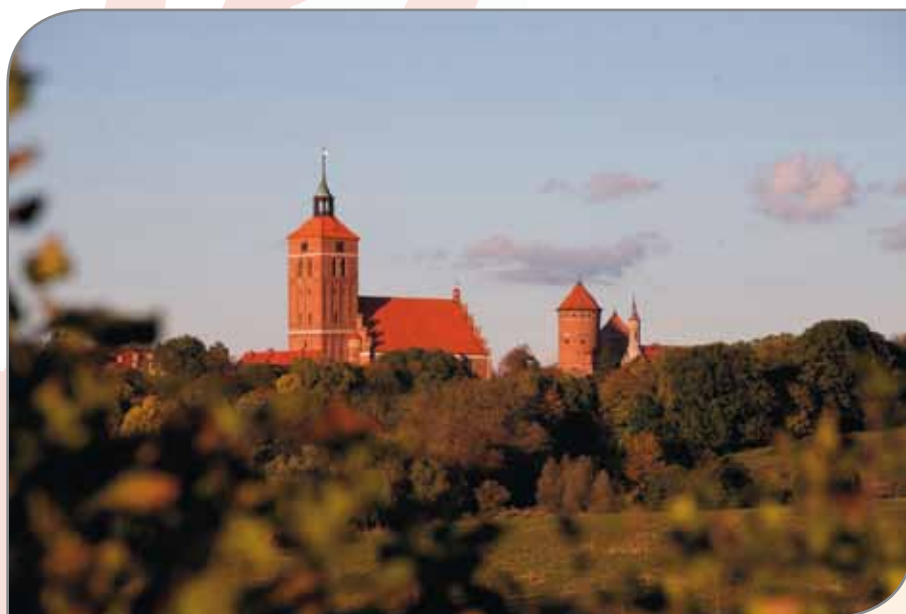
Panorama Reszla i okolic.

Interesujący projekt jest realizowany w Kaletach. Poddano tam rewitalizacji od dawna istniejące stawy, które zostały zdegradowane w okresie funkcjonowania pobliskich zakładów przemysłowych. Po likwidacji tych zakładów i okresie stagnacji nad stawami urządzono IchtioPark, będący dobrze zaprogramowanym terenem rekreacyjnym. Zadbano m.in. o informację wizualną dotyczącą gatunków ryb występujących w stawach.